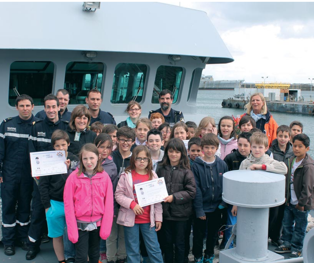
En septembre dernier, la venue d'Églantine à Pornic avait permis de nouer des liens solides entre les élèves de l'école Kerlor et l'équipage du navire-école de la Marine nationale.