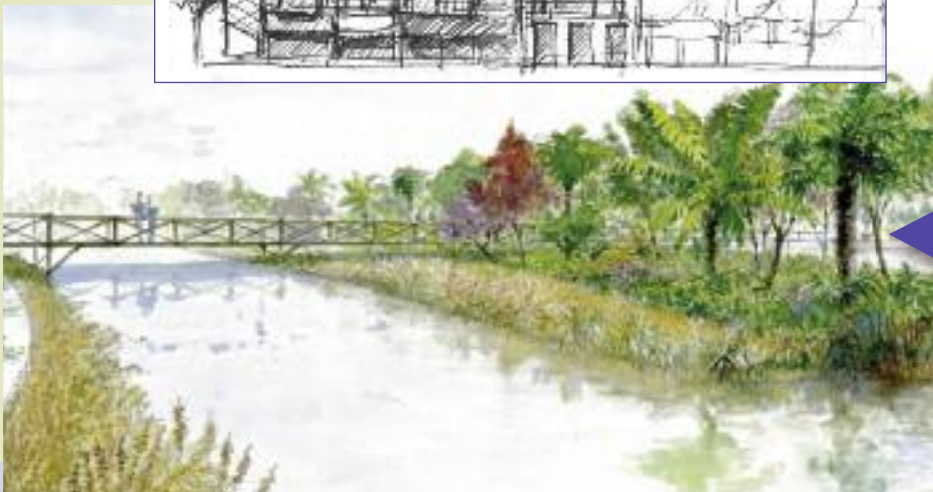
Devant le complexe : le débarquement des plantes entre terre et mer.