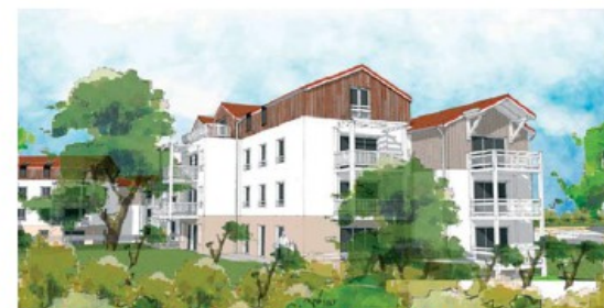
Le Chasse-Marée: un programme de huit appartements en location-accession sous le label BBC.